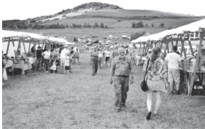
Mintegy harminc termelő hozta el a vidék jellegzetes termékeit

Nemcsak kézműves termékeit, hanem kulturális értékeit, néptáncait is bemutatta a Kis-Küküllő felső vidéke, hiszen az erdőszentgyörgyi Százfónat, a gyulakutai Szivárvány, a sóváradai Szuszékdöngetők, a kibédi Piros Koszorú, a balavásári Vásár együttesek léptek színpadra szombaton moldovai, magyarlapádi, nyárádmenti, kölpényi, mezőszéki és vajdaszentiványi táncokkal, és a vajdaszentiványiakat is meghívták, hogy saját táncukat is maguk is bemutassák a közönségnek.