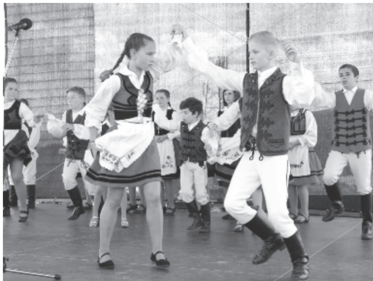
Néptánci figuráit, étkeinek ízét is bemutatta a vidék